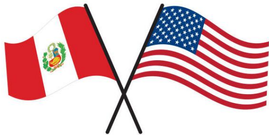
Flags of Peru and the United States

parts of Peru to be the Bishop of Chiclayo. Bishop Prevost also served as a member of the Congregation for Clergy and the Congregation for Bishops. In 2023 he was named a cardinal and the leader of the Dicastery for Bishops (formally the Congregation for Bishops) as well as the president of the Pontifical Commission for Latin America ( http://press.vatican.va ).