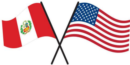
Banderas de Perú y Los Estados Unidos